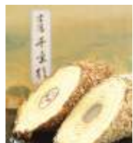
姫路・杵屋の千年杉

ロールケーキとチーズケーキがベスト・コラボレーション! しっとりもちもち食感で、ずっしり重みがあるロールC。甘みが少ないので、男性にも人気有り。