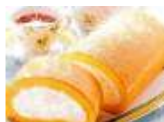
噂の、大阪・堂島ロール

スポンジもクリームも豆乳使用のヘルシーさ。口当たりよく、食べごたえあるのに、重過ぎず低カロリーで、お正月太り後でも大丈夫!