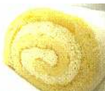
上田オススメ♪ 心斎橋チーズロール

四天王のもう一つ。ロールする限界量のたっぷりクリーム。切らずに、フォーク片手に一人で食べきってしまう美味しさだそう。行列必至!