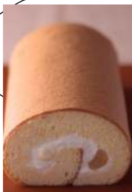
神戸・小山ロール